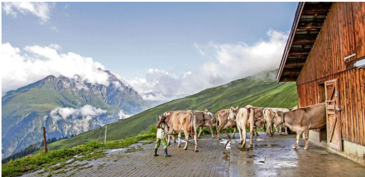
L'alp Gün en Val Stussavgia è ina da radund 750 alps grischunas che vegn cultivada durant la stad.